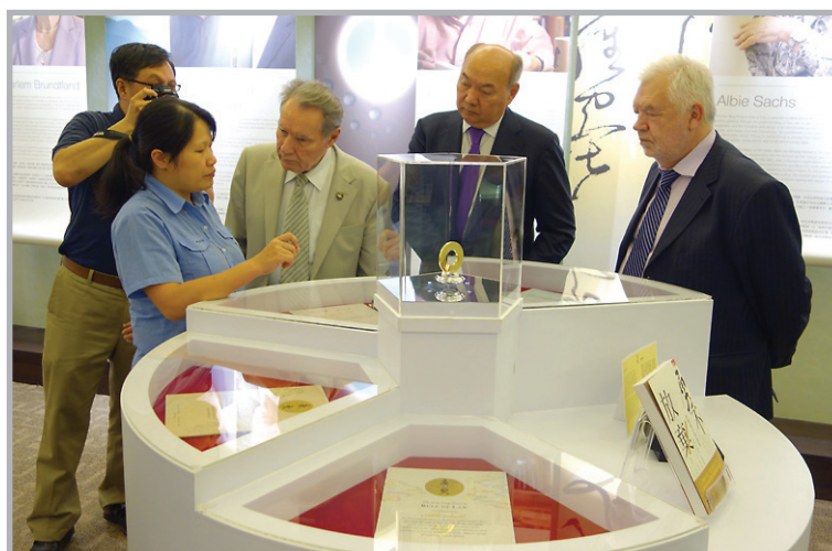
В музее премии Тан