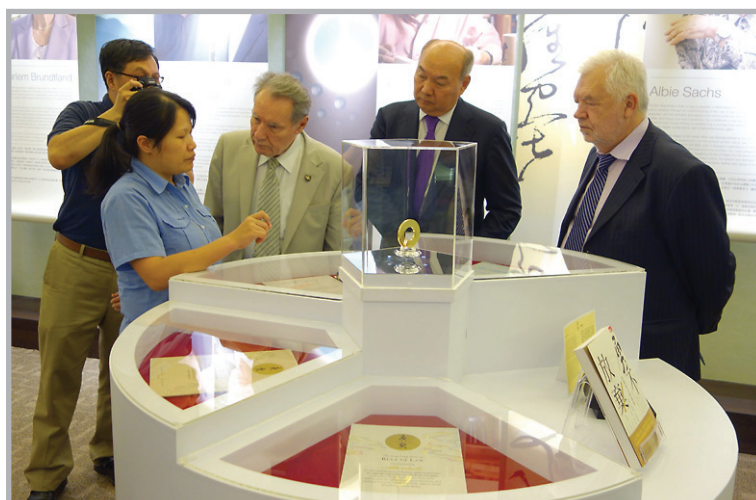
В музее премии Тан