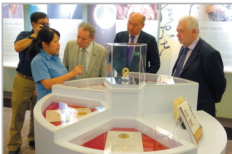
В музее премии Тан